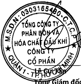
Tổng Giám đốc

Thay mặt và đại diện cho Ban Tổng Giám đốc,