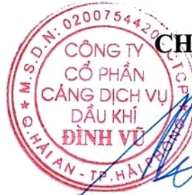
Lương Quốc Phương