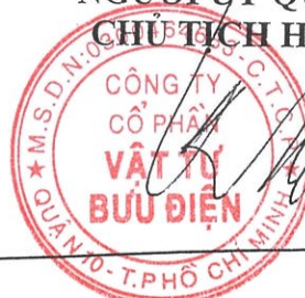
NGÔ XUÂN TRƯỜNG