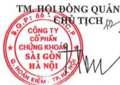
ĐỖ QUANG HIỀN