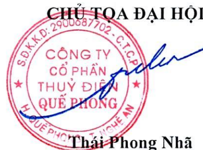
Thái Phong Nhã