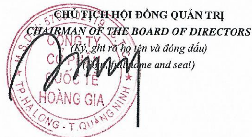
Chen Yu Chen