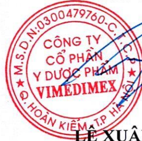
LÊ XUÂN TÙNG