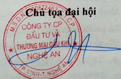
Đường Dũng Tiến