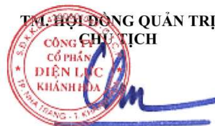
Nguyễn Cao Kỳ