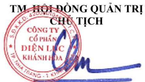
Nguyễn Cao Ký