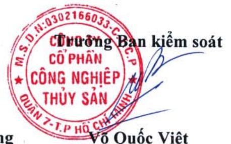
Võ Quốc Việt