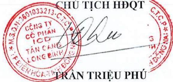
TRẦN TRIỆU PHÚ