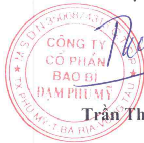
Trần Thượng Tín