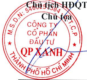
PHẠM TỰ TRỌNG