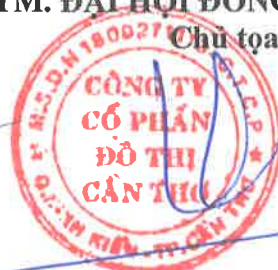
Lưu Việt Chiến