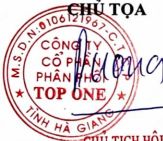
CHỦ TỊCH HỘI ĐỒNG QUẢN TRỊ