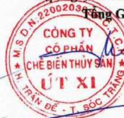
Lý Bích Quyên