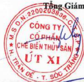
Lý Bích Quyên