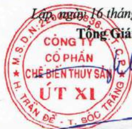
Lý Bích Quyên