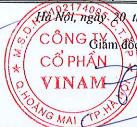
Đặng Việt Thắng