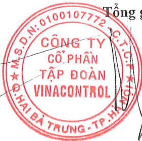
Mai Tiến Dũng