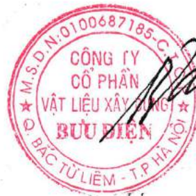
Đào Huy Trường