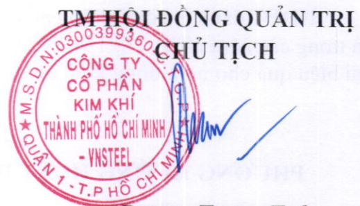
Dương Trung Toàn

Trên đây là một số nét về kết quả hoạt động nhiệm kỳ 2019-2024 và phương hướng nhiệm kỳ 2024-2029, xin báo cáo trước đại hội.