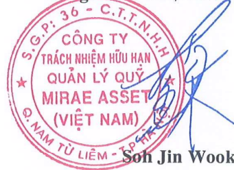
Son Jin Wook