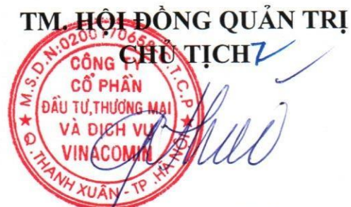
Thiều Quang Thảo