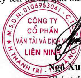
Ngô Xuân Phú Chủ tịch HĐQT

Cuộc họp kết thúc hồi 16h00 ngày 18 tháng 05 năm 2022. Biên bản này được toàn bộ thành viên HĐQT đọc và ký tên thông qua dưới đây: