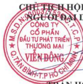
TRAN HOÀNG NGHĨA