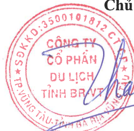
THÁI HOÀNG THÂN