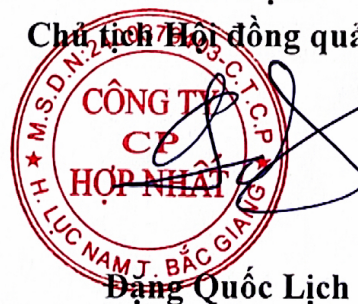
Đặng Quốc Lịch