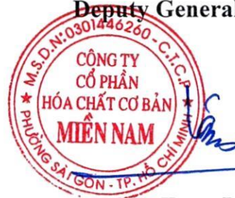
Le Tung Lam