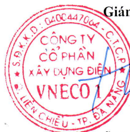
Đỗ Như Hiệp

(Các thuyết minh từ trang 05 đến trang 19 là bộ phận hợp thành của Báo cáo tài chính này.)