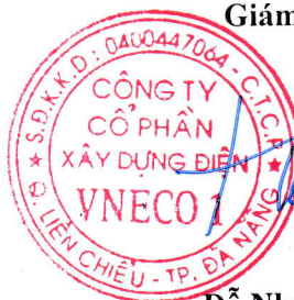
Đỗ Như Hiệp

(Các thuyết minh từ trang 05 đến trang 19 là bộ phận hợp thành của Báo cáo tài chính này.)