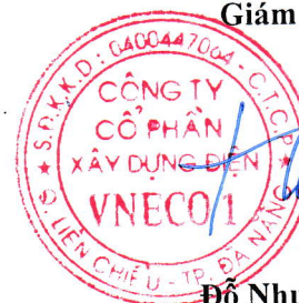
Đỗ Như Hiệp