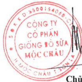
Chủ tịch Mai Kiều Liên