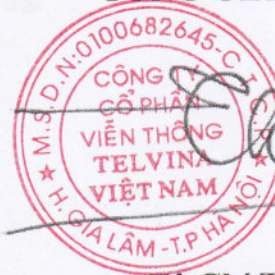
Tô Chí Thành