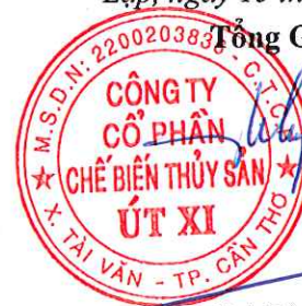
Lý Bích Quyên