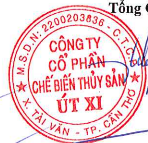
Lý Bích Quyên