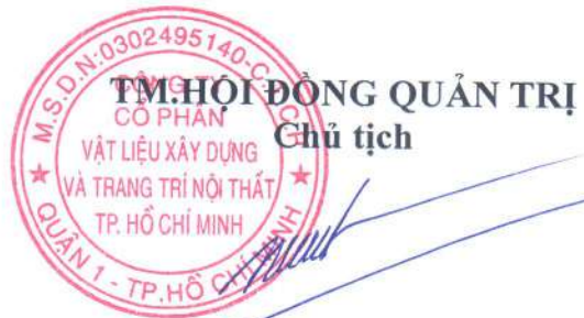
Trương Minh Tuyên

Ứng cử viên trúng cử là ứng cử viên có số phiếu bầu phải đảm bảo ít nhất 65% số lượng cổ phần có quyền biểu quyết tham dự Đại hội.