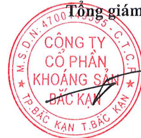
Đình Văn Hiến