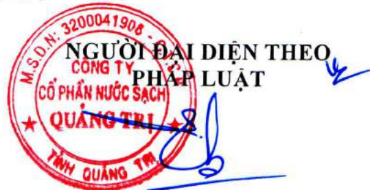
Đào Bá Hiếu Chủ tịch HĐQT