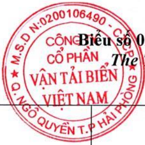
Biểu số 02: Danh sách người nội bộ và người có liên quan của người nội bộ của VOSCO The Table 02: The list of internal persons and affiliated persons of the Company