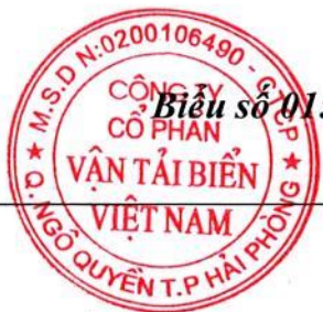
Biểu số 01: Danh sách về người nội bộ của công ty/ The Table 01: The list of internal persons of the Company