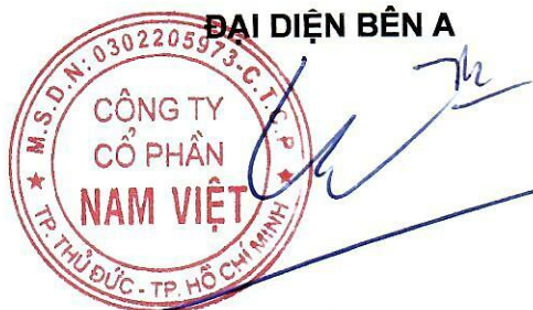
HOÀNG KIỀU PHONG

Hợp đồng này tự động được thanh lý sau khi bên A và bên B đã hoàn thành trách nhiệm của mỗi bên.