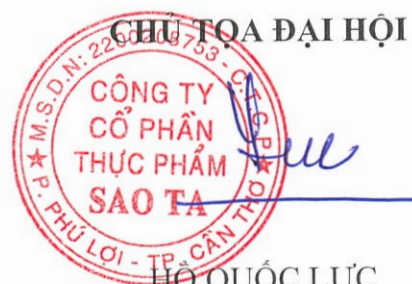
HỒ QUỐC LỰC