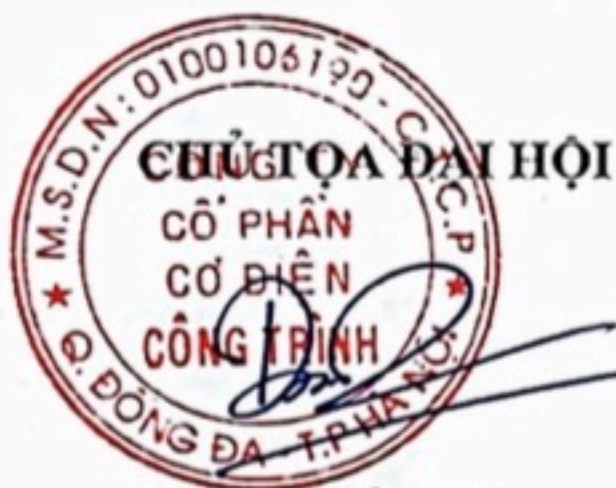
Cao Tiến Dũng

Đại hội đồng cổ đông thường niên năm 2023 Công ty cổ phần Cơ điện Công trình kết thúc vào lúc 10h30 phút cùng ngày./.