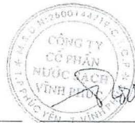
Ngô Trường Giang Chủ tịch Hội đồng Quản trị