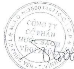
Ngô Trường Giang Chủ tịch Hội đồng Quản trị