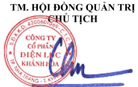
Nguyễn Cao Ký