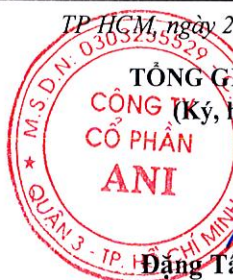
Đặng Tất Thành