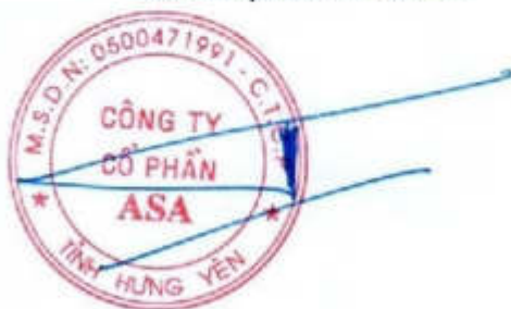
Cao Tấn Thành