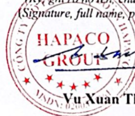
Vu Xuân Thịnh

(Ký, ghi rõ họ tên, chức vụ, đóng dấu) (Signature, full name, position, and seal)