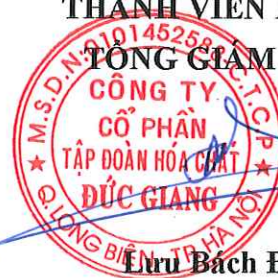
Lưu Bách Đạt