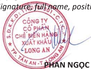
PHAN NGỌC SƠN

(Ký, ghi rõ họ tên, chức vụ, đóng dấu) (Signature, full name, position, and seal)