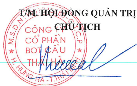
NGÔ TIẾN CƯƠNG