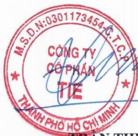
TRẦN THẾ VINH

A red circular stamp, partially visible on the right side, with the text "CÔNG TY CỔ PHẦN TIE" and "THÀNH PHỐ HỒ CHÍ MINH".