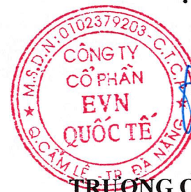
TRƯƠNG QUANG MINH