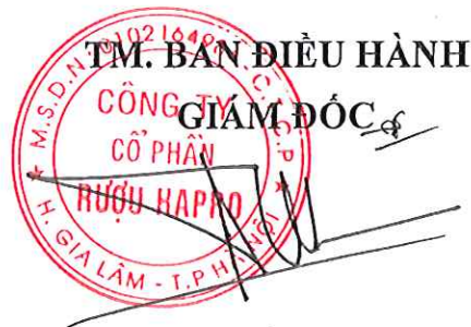
Đinh Tiến Thành