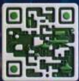
GS1 QR Code

Tên thuốc: Viên nén Hòa dược Alpha-Beta 500mg